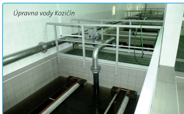
Úpravná vody Kozičín