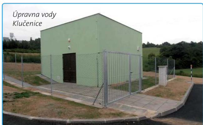
Úpravná vody Klučnice

Také v následujícím roce bude zlepšování kvality dodávané pitné vody věnována zvýšená pozornost. Zahájena bude příprava projektové dokumentace na celkovou rekonstrukci a modernizaci úpravný vody Hvězdička zásobující pitnou vodou skupinový vodovod Příbram – svazek obcí.