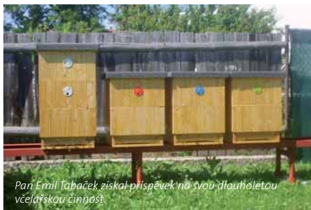
Pan Emil Tabaček získal příspěvek na svou dlouholetou včelařskou činnost.