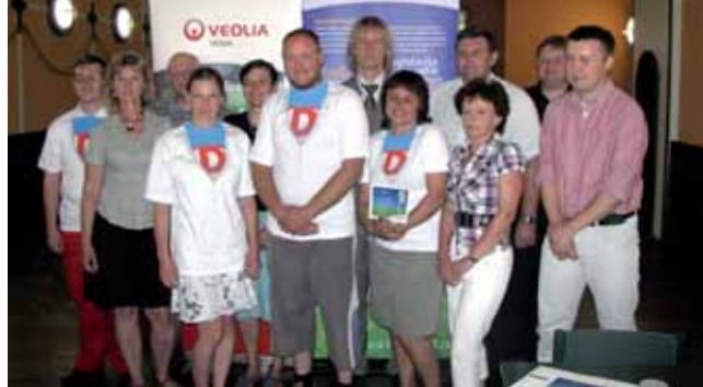
Předávání MiNiGRANTŮ a BioGRANTŮ úspěšným žadatelům.

BioGRANTY se rozdělují druhým rokem a letos z nich v celé společnosti Veolia získalo podporu celkem jedenatřicet projektů.