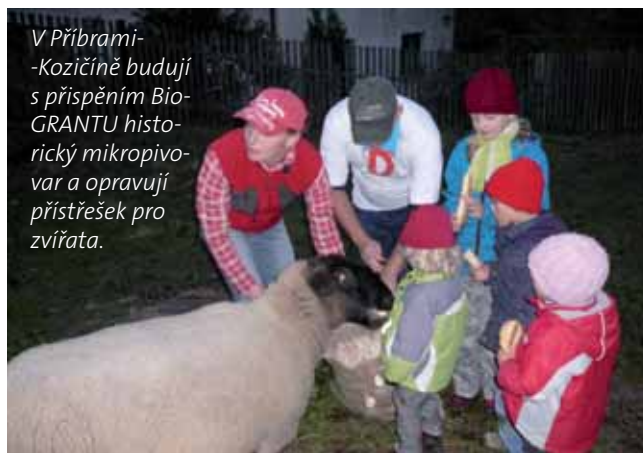
V Příbrami-Kozičíně budují s přispěním BioGRANTU historický mikropivovar a opravují přístřešek pro zvířata.